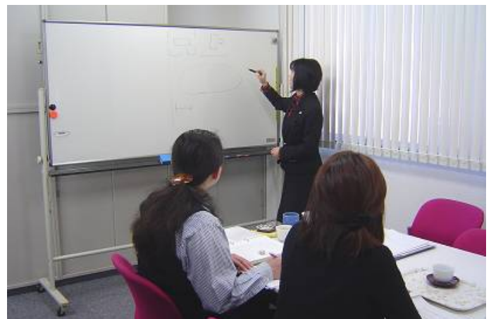
弊社2階の会議室で研修を行ないます。 マンツーマンなので質問を受け付けながらすすめています。

ご要望に応じて、学生から社会人への意識の切り替え、仕事のすすめ方、指示の受け方、プレゼンテーションスキルの向上などにプログラムを変更することも可能です。