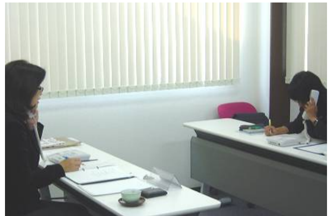
電話応対の練習です。できるまで何度も繰り返します。

まず、働く意識とマナーが統一されてきたので、仕事の指導がしやすくなりました。また、社内の雰囲気がよくなり、新しくはいつてきたメンバーもその状態があたりまえと受け止めるので、どんどん組織風土がよくなっています。